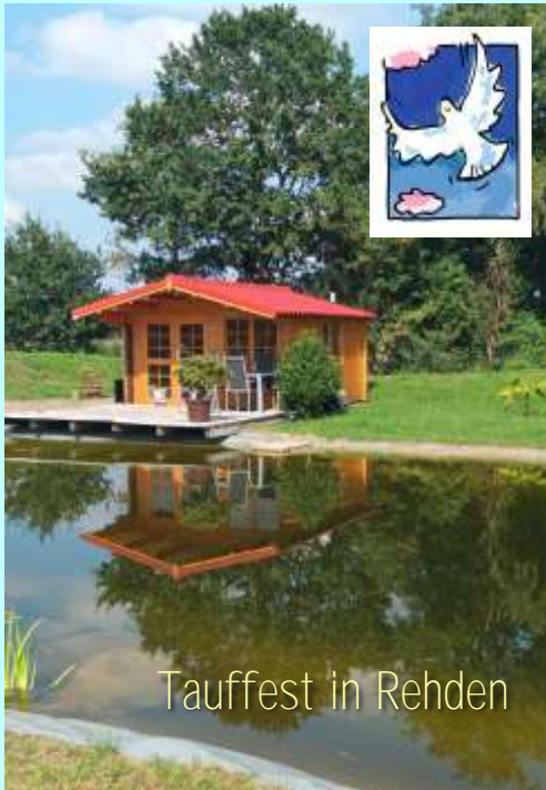
Taufest in Rehden

Im Sommer 2025 laden die Kirchengemeinden Rehden-Hemsloh, Wetschen und Barver wieder zu einem großen gemeinsamen Tauffest ein. Es wird am Sonntag, den 24. August, unter freiem Himmel auf dem Gelände der Familie Rohlfs in Rehden, auf dem es einen idyllischen Teich gibt, stattfinden. Wir hoffen alle, dass das Wetter mitspielt und wir nicht nur einen schönen Gottesdienst mit Taufen um 11 Uhr feiern, sondern anschließend - wie in den Jahren 22 und 23 - ein gemütliches Miteinander erleben werden, zu dem gegrillt werden wird.