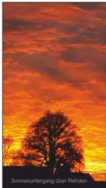
Sonnenuntergang über Rehden