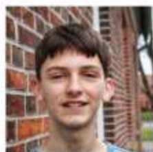
Robin Fette Enger Weg 4 49453 Hemsloh