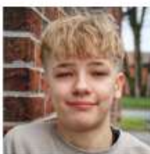
Thies Mackenstedt Siebenhäuser Str. 12 49453 Rehden